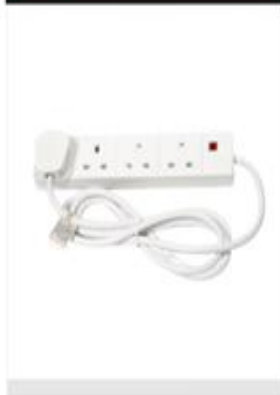
272121 - 4 Way 2m Extension Socket Lead