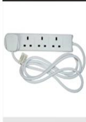
272122 - 4 Way 5m Extension Socket Lead