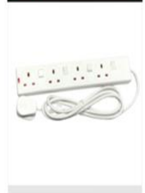
272125 - 4G 2m 13A Switched Extension Lead