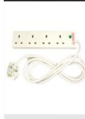
272123 - 4 Way 2m Surge Protection Extension